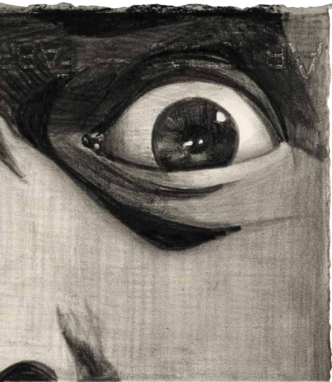
Egon Senn , 'Pinwheels' Öl , 30 x 45 cm