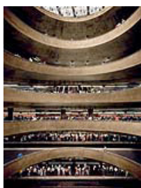
Andreas Gursky, São Paulo, Sé, 2002, 298 x 211,5 cm

Wir bitten um Verständnis, dass die Nutzung der abgebildeten Werke nur unter den engen Voraussetzungen der aktuellen Berichterstattung zulässig ist.