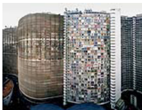
Andreas Gursky, Copan, 2002, 237,1 x 301,3 cm