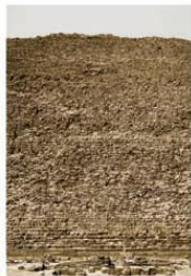
Andreas Gursky, Cheops, 2005, 307,2 x 217,2 x 6,2 cm © Andreas Gursky/VG Bild-Kunst, Bonn, 2008 Courtesy: Monika Sprüth/Philomene Magers, Köln München London