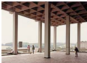
Andreas Gursky, Bochum, Uni, 1988, 182 x 237,5 cm