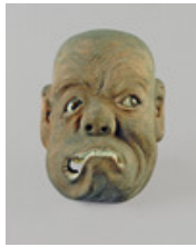
Anonym, Japan Maske (grimassenverzerrtes Gesicht) 19. Jh., Holz, farbig gefasst, Glas, 17 x 12,2 x 8 cm Paris, Musée Rodin