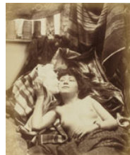
Anonym Liegende junge Frau mit entblößter Brust, eine Maske neben dem Gesicht haltend um 1870, Albuminabzug von einem Glasnegativ im Kollodium- Verfahren, 19,6 x 16,2 cm Paris, Musée d'Orsay