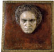
Franz von Stuck Ludwig van Beethoven (1770 - 1827) 1902, Gips, bemalt und vergoldet, 48 x 48 x 14 cm Paris, Musée d'Orsay