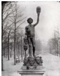
Zacharie Astruc Der Maskenhändler 1883, Bronze, 170 x 74 x 87,5 cm Paris, Jardin du Luxembourg, Dauerleihgabe des Musée d'Orsay