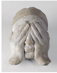
Adolphe Victor Geoffroy-Dechaume Gesichtsabformung des Louis Steinheil (1814–1885), die Hände vor den Augen haltend 1834, Gips, 26 x 19 x 13 cm Paris, Musée des Monuments Français - Cité de l'Architecture et du Patrimoine