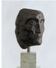
Pablo Picasso Maske eines Picadors mit gebrochener Nase 1903, Bronze, 18,5 x 13 x 11 cm Kunsthhaus Zürich © Succession Picasso / VG BILD-KUNST, Bonn 2009