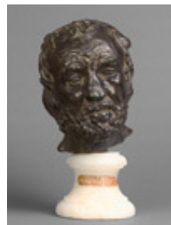
Auguste Rodin Mann mit gebrochener Nase (zwischen 1862 und 1864), Typ II um 1903, Bronze, 39 x 21,2 x 23,2 cm Paris, Musée d'Orsay