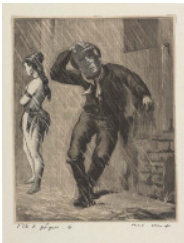
Max Ernst Une semaine de Bonté, L'île de Pâques 6 1934, Schuber mit 5 Heften, 20 x 14,7 cm (Bild) Bonn, Privatsammlung Dr. Jürgen Pech

Wir bitten um Verständnis, dass die Nutzung der abgebildeten Werke nur unter den engen Voraussetzungen der aktuellen Berichterstattung zulässig ist.